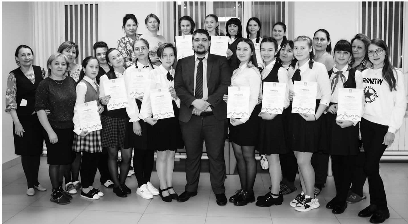
Менә алар – әйдаманнар.

Балаларны яраткан, тирә-юньдәге үзгәрешләргә битараф булмаган, һәрвакыт яңалыкка, камиллеккә омтылган егет-кызлар, әйдаманнар буларак, үзләре артыннан күпләрне ияртергә сәләтле.