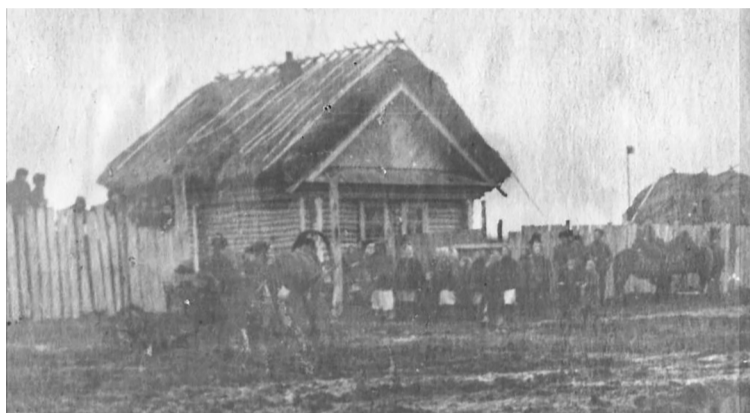
☉ Фото – Наҗия Исәнбаеваның гаилә архивынан.

■ Бу – минем туып-үскән нигезем... Бу – минем туган авыл! Моннан бик күп еллар элек әтибездә күрше Атлас авылынан әнибездә шушы нигезгә алып кайткан.